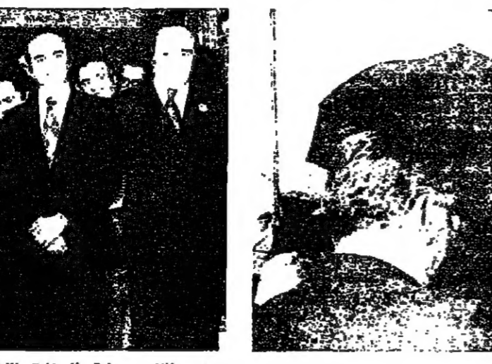
في مطار بيروت